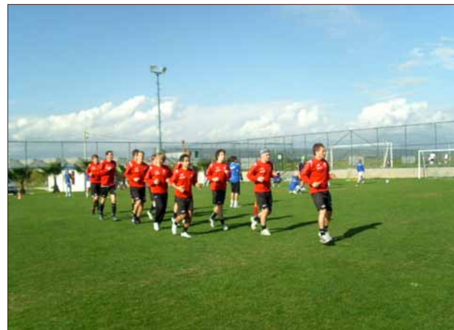
Oppvarming før Molde-kampen.

Om kveldene var det også nok av aktiviteter å ta seg til: Hotellet hadde en egen avdeling som de kalte Gamezone. Her var det champions league på storskjerm, internett, bowling, biljard, airhockey og basketball for å nevne noe. Dersom noen ble tørste, var det bare å forsyne seg med brus eller kaffi i baren. Vi hadde også fellessamlinger tre kvelder.