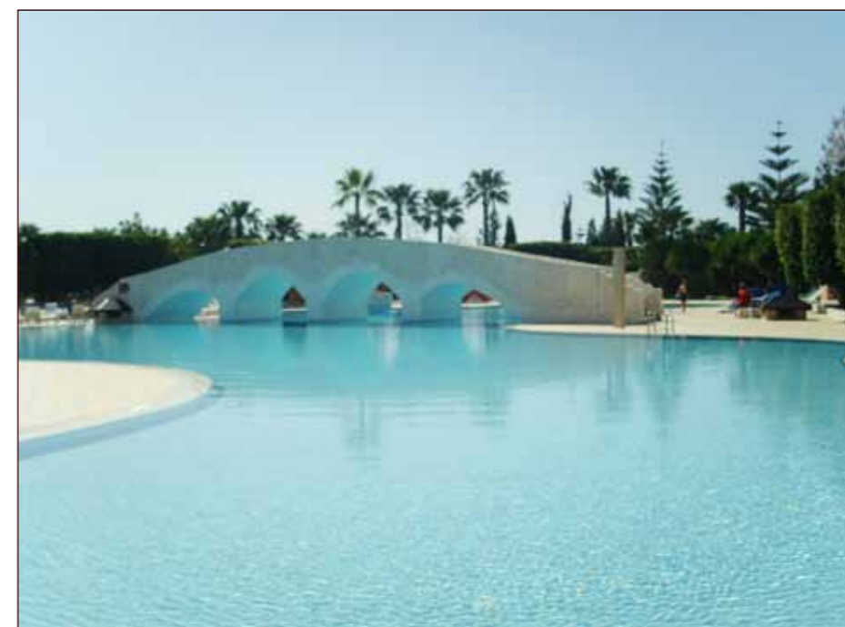
Et av bassengene på hotellet.