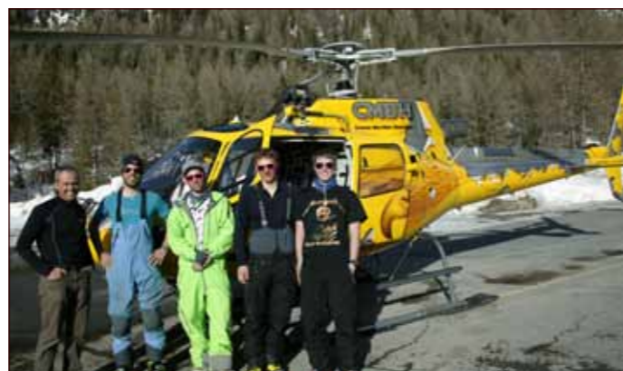
Nokre av dei modigaste karane let ikkje sjansen til ein luftig tur med helikopter gå frå seg!