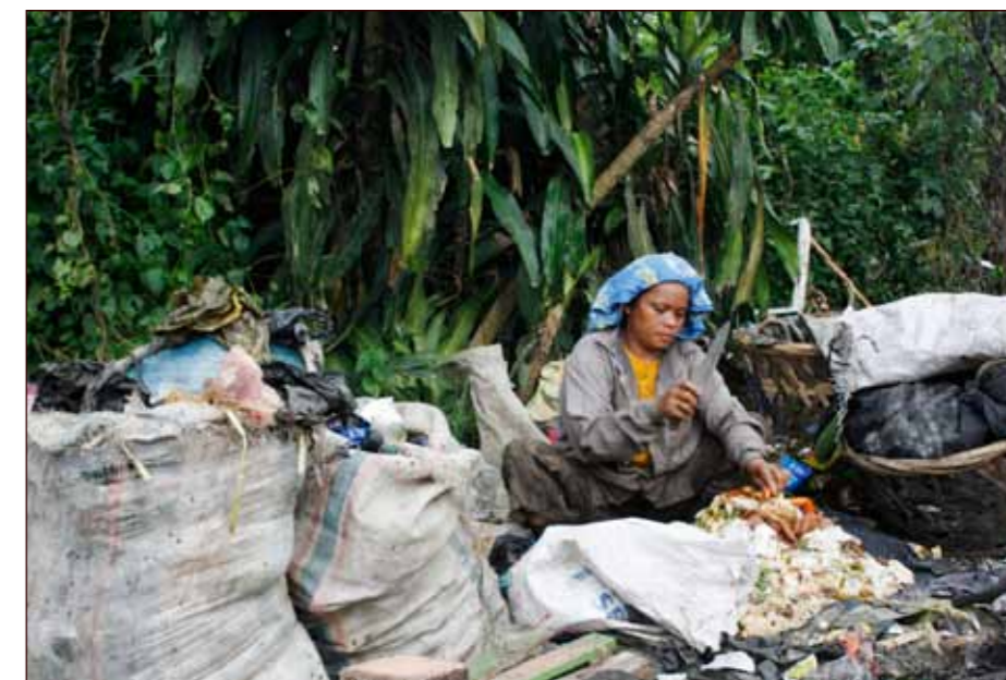
Matrestar vert foredla og seld vidare som dyrefor.

sorterte søppel og lite smil, var det som møtte oss på søppelfyllinga. Sjå for deg at du går inn i ein dyrehage og ser på dyr i bur. Slik var det nesten å gå på søppelfyllinga. Ungdommar på vår eigen alder gøymde seg blant trea fordi dei var så flau. Dei gjorde berre det dei måtte; plukka søppel. Det var tung stemning blant dei som jobba der, utan smil og latter, men mest mangel på håp. Tenk at me får lov til å hjelpa desse menneska!