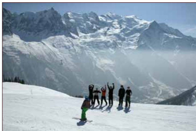
Kan ein ha det finare? Knallvêr i eit storslått landskap.