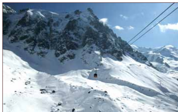
Luftige opplevingar i Chamonix.