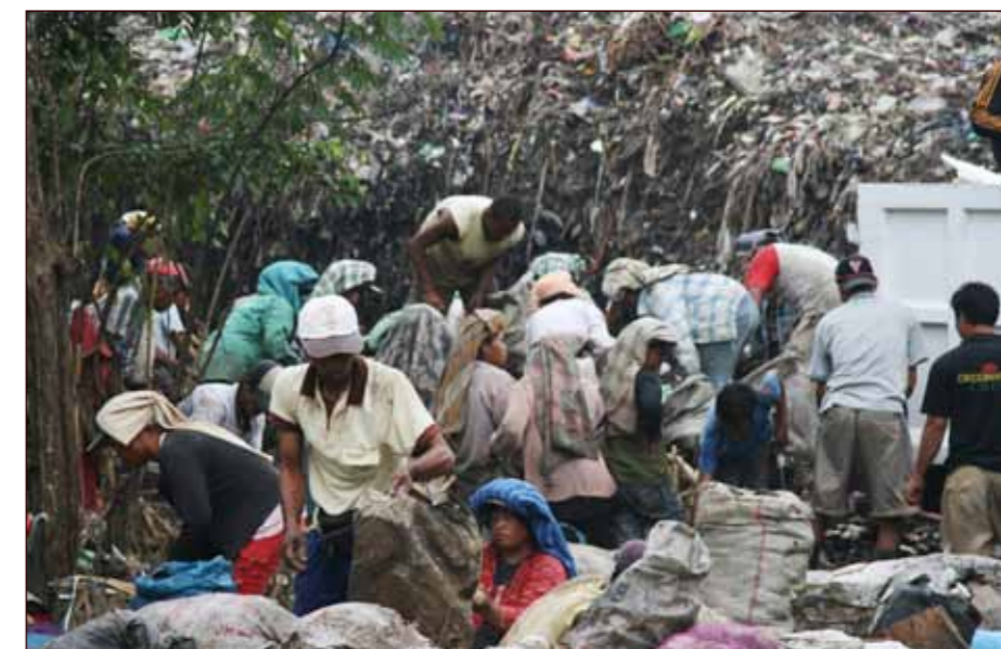
Folkehavet på søppelfyllinga.

For Misjonsprosjektskomitéen: Tone Marit Håland Dyrkolbotn