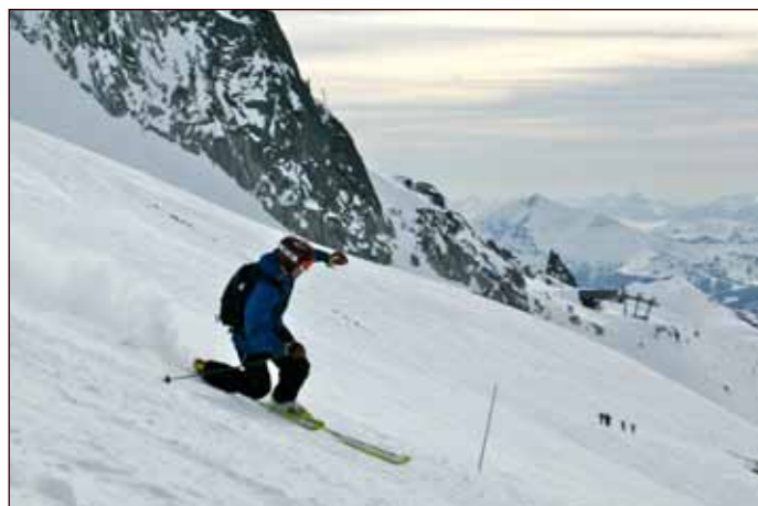
Fine tilhøve for telemarkkøyring.