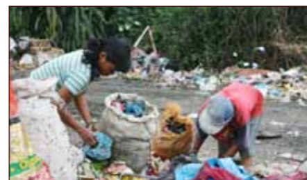
Bosset gjev pengar til å overleva.