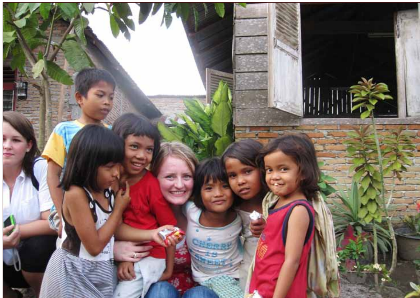
Saman med nokre av dei livsglade borna.