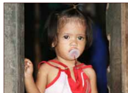
Kva vil framtida bringa?

Å sjå prosjekta var veldig sterkt og rørande. Stinkande søppel, daude rotter, slitne og håplause menneske som