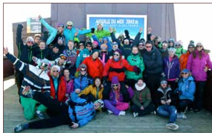
Gjengen samla høgt til fjells i dei franske alpane.