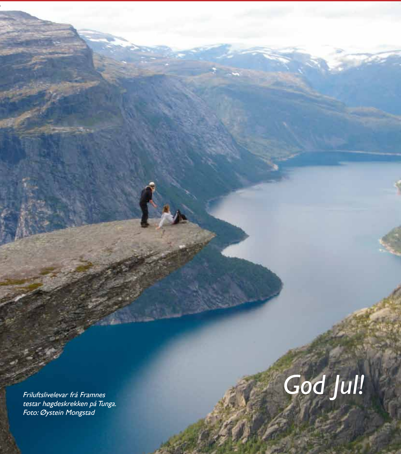
Friluftslivevar frå Framnes testar høgdeskrekken på Tunga.