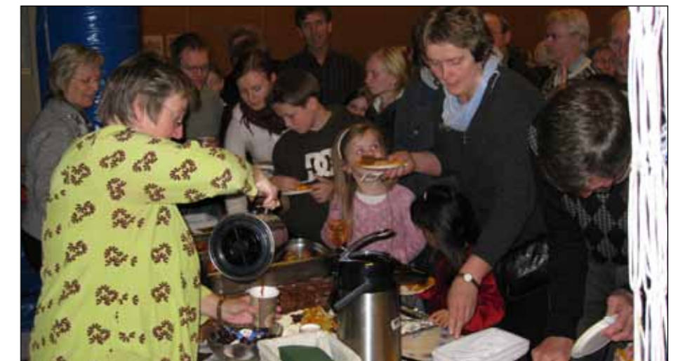
Kafé: Det var kaffi og kaker til alle.