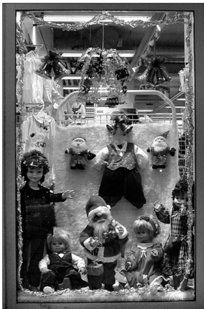
Julebodskapen har lett for å drukna i glitter og stas. Julehøgtida er noko langt meir enn ytre staffasje. Den største gåva, Jesus Kristus, har me allereie fått!