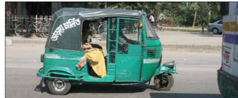
Kjøretøy: Motorisert taxi.

unge kristne. Noen kommer fra kristne familier, andre har muslimsk og hinduistisk bakgrunn. De kommer ofte fra fattige familier som ikke har råd til å betale leirene selv.