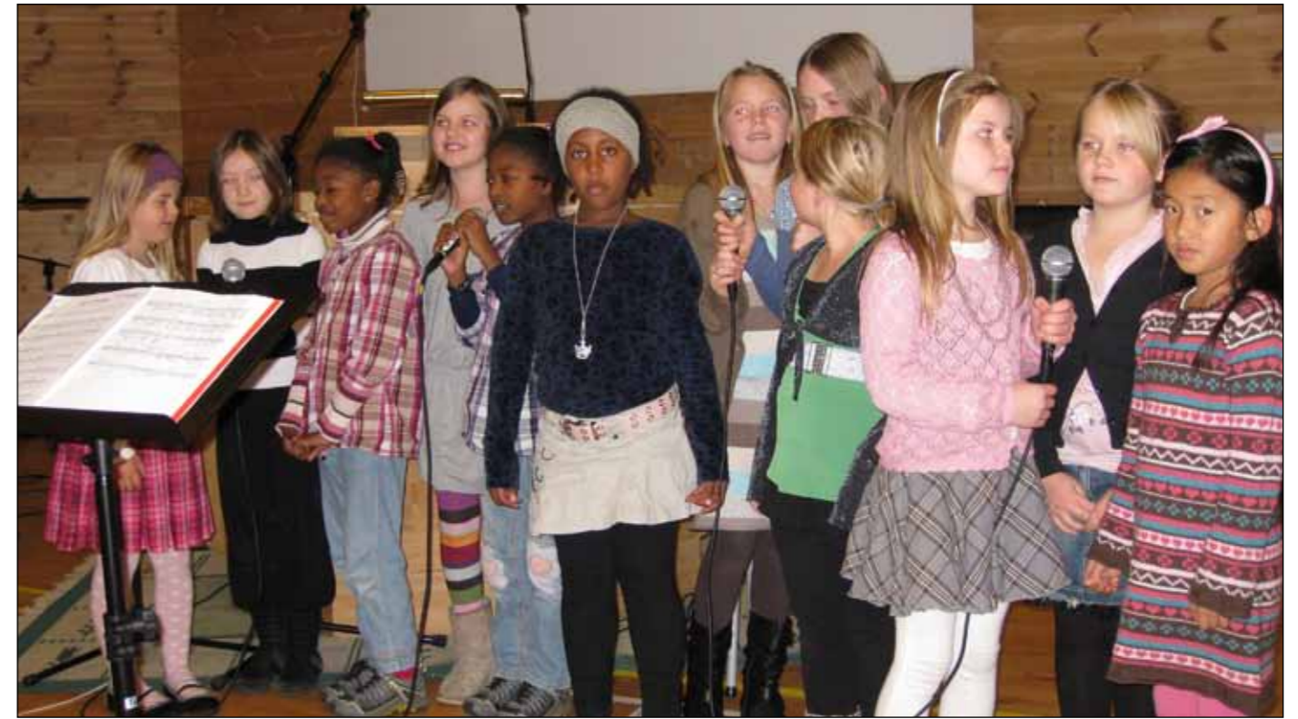
Barnesang: Barnegospelkoret Shine song friskt om Jesus.