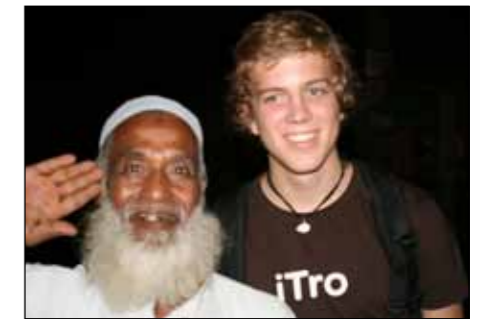
Smil: Vi møtte bare positive mennesker, folk var gjestfrie og hadde ingenting i mot å bli tatt bilde av.

Bangladeshturen var en fantastisk tur med mye informasjon på kort tid! Vi var der bare i 5 dager, men fikk likevel oppleve utrolig mye. Bangladesh var som en helt annen verden. Å kjøre rundt i dette landet er noe av det som jeg kommer til å huske i lang tid fremover. Det var ingen trafikkregler med unntak av én, tut og kjør regelen. Under det korte oppholdet opplevde vi å se flere trafikkulykker. Blant annet et ukjent