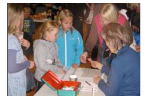
Åresal: Mange kjøpte årar.